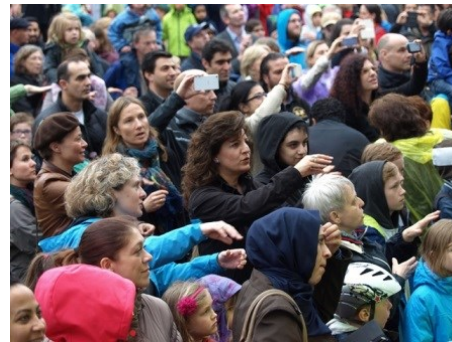
Hier wird gemeinsam "Inklusion" gebärdet.

Die Fackelankunft kann mit einer anderen Veranstaltung zusammengelegt werden, wenn sich das thematisch anbietet.